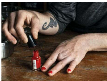
Carina Linge, Identität , 2019, © Carina Linge / Courtesy: Jarmuschek + Partner