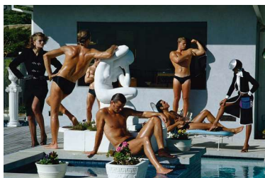
Helmut Newton, Stern, Los Angeles, 1980, © Helmut Newton Estate / Courtesy: Helmut Newton Foundation