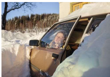
Espen Eichhöfer, Bil, a.d.S. Papa, Gerd und der Nordmann, 2017—2020, © Espen Eichhöfer/OSTKREUZ / Courtesy: Akademie der Künste, Berlin