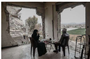
Sameer Al-Doumy, Another Face of War, Syria, a.d.S. Another Face of War, Syria , 2019, © Sameer Al-Doumy / Courtesy: CLB Berlin