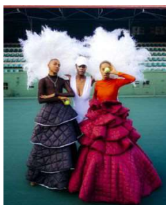
Birk Alisch, Gamechangers , 2020, © Birk Alisch, 2020 / Courtesy: Lette Verein Berlin