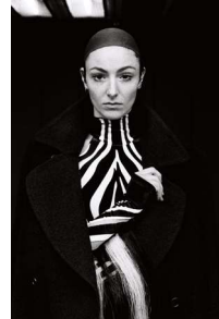
Sven Marquardt, Hanna, 2019, © Sven Marquardt, Courtesy: Friedrichstadt-Palast