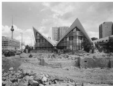
Thomas Platow, Gaststätte „Ahornblatt“ auf der Fischerinsel, Gertraudenstraße (Mitte), 8. August 2000 , © Landesarchiv Berlin, Thomas Platow / Courtesy: Landesarchiv Berlin