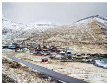
janKB, o.T., a.d.S. Ein Mann, die Insel und eine Fliege im Raum , 2018, © janKB / Courtesy: Fotopioniere Louis@Nicéphore