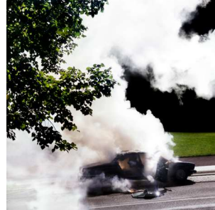
Sascha Weidner, Implode II, 2010, © Sascha Weidner Estate, Courtesy: Dorothee Nilsson Gallery