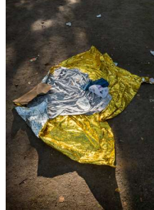
Michael Danner, Migration as Avant-Garde, 2008—2017