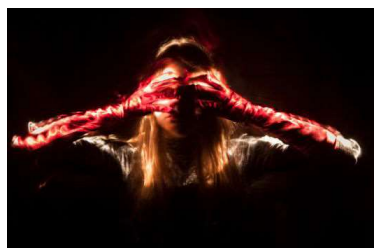
Susanne Emmermann, o.T., 2017