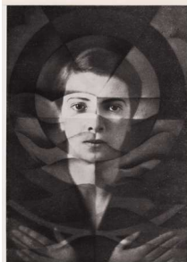
Yva, Selbstporträt, 1926, © DAS VERBORGENE MUSEUM / Courtesy: DAS VERBORGENE MUSEUM