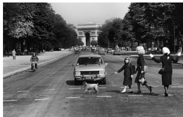
Roger Melis, Avenue Foch, a.d.S. Paris zu Fuß , 1982, © Nachlaß Roger Melis / Mathias Bertram, Courtesy: argus fotokunst