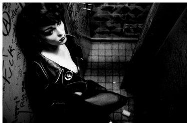
Miron Zownir, Berlin, 1980