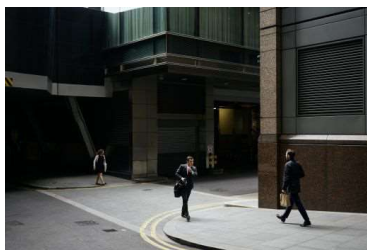
Dawin Meckel, Pindar Street, a.d.S. Die Wand, 2017—2018, © Dawin Meckel/OSTKREUZ / Courtesy: Akademie der Künste, Berlin