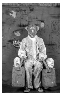
Roger Ballen, Bounty, a.d.S. Roger the Rat, 2017, © Roger Ballen / Courtesy: ARTCO Gallery