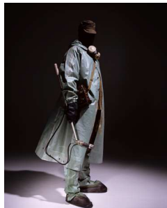
Andreas Mühe, Biorobot II, 2020, © VG Bild-Kunst, Bonn, Courtesy: St. Matthäus-Kirche