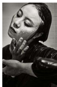
Klaus Mellenthin, Ein Scheffel Perlen, 2019, © Klaus Mellenthin | BFF Professional / Courtesy: BFF — Berufsverband freier Fotografen und Filmgestalter e. V.