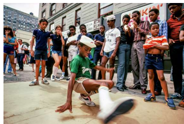
Martha Cooper, B-Boys breaking on cardboard, Upper Westside, NYC, 1982, © Martha Cooper, Courtesy: URBAN NATION — Museum for urban contemporary art