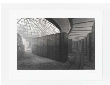
Fiona Tan, Shadow Archive IV, 2019, © Fiona Tan / Courtesy: BORCH Gallery & Editions, Copenhagen/Berlin